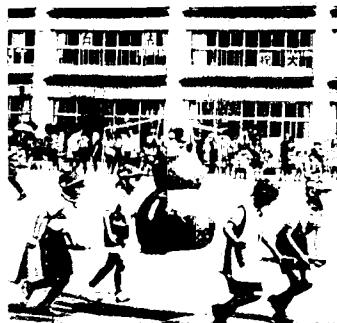
一年 あらさわ らいと

ぼくは、八十メートルそうをいばんがんばりました。いいをめざしてぜんりよくをだしきりました。二いだったけど、とつてもうれしかったです。 らいねんは、もつれんしゅうをして、いいをめざします。