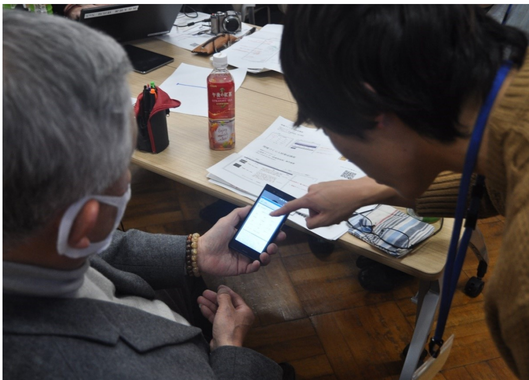
学生から説明を受けながら投稿作業を進める様子

説明の後、参加者それぞれが宿題となっていた「近所の危険個所」をマップにアップロードする作業を行った。簡単に投稿できるようになっているサイトだが、スマートフォンの操作に不慣れな方もおり慎重に項目を入力しながら行った。