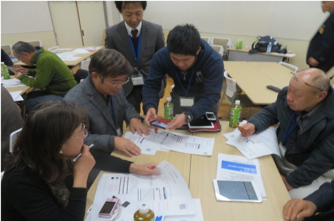
グループワークにて学生と協働して災害情報の投稿を進める様子